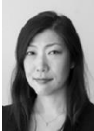
دکتور نائوکو ئاراکاوا , BPharm, MSc, PhD, FHEA,

نائوکو ئاراکاوا پیشهنگی جیهانییه له ناوہندی پھرمیڈانی هیزی کاری FIP بۆ پھرمیڈانی لیهاتوویی، ئهندامی لیژنهی بهرئوبهری بهشی دھرمانسازی ئهکادیمی FIP ، و یاریدهدھری مامۆستای دھرمانسازی نیودهولتهتییه له زانکۆی ئوتینگهام له بهریتانیا. کارمکانی بریتین له کۆمپلێک پروژهی توئزینمه بۆ پھرمیڈانی چوارچیهی نیشتمانی لیهاتوویی دھرمانسازی له ولاته جیاوازمکاندا.