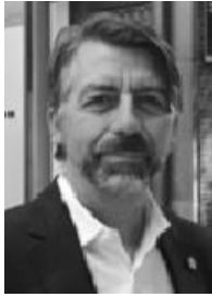
پروفیسور ٹیان بہیتس , FRPharms , FFIP, FRSS

ٹیان بہیتس سرۆکی پھروہدی دھرمانسازی له قوتابخانہی دھرمانسازی UCL ههیه و بهرئوبهری چاودیری دھرمانی جیهانی FIP و ناوہندی پھرمیڈانی هیزی کاره. بهرئوبهری پھروگرامه بۆ پھروگرامه پیشهیهکانی UCL ، دابینکردنی بناغه، راهینانی پیشکهموتوو و پھروہدی شوینی کار بۆ دھرمانسازمکانی NHS له FIP ، رۆلی سهرمکی ههجو له نووسین و دهستپنکردنی ئامانجه سهرمتابیهکانی پھرمیڈانی هیزی کاری جیهانی و ئامانجهکانی دواتر بۆ پھرمیڈانی FIP له سالی 2021.